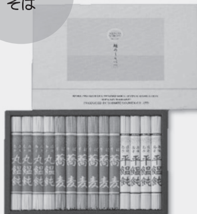
④LS-50 麺のしらべ 丸・平うどん 各90g×4束 そば 90g×6束 定価 5,616円 特別販売価格 3,250円