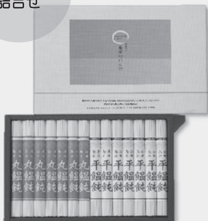
③VS-45 島原のれん 丸・平うどん 各90g×7束 定価 5,076円 特別販売価格 3,130円