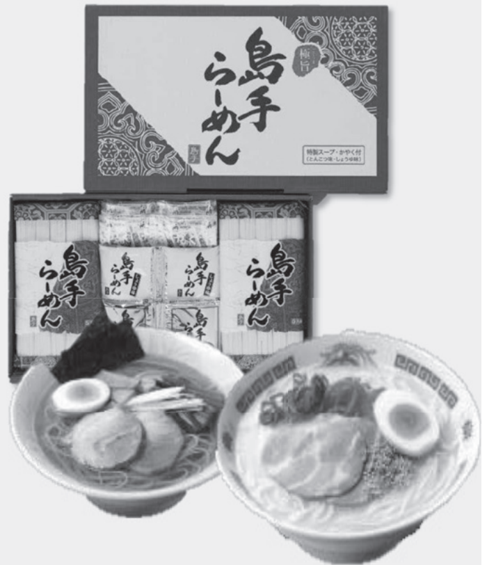
②SR-1 島手らーめん とんこつ・醤油各5食入り (麺・スープのみ) 定価 3,132円 特別販売価格 2,200円