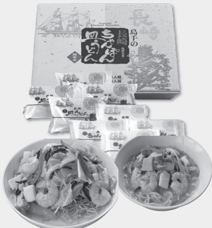
①N-1 ちゃんぽん皿うどん ちゃんぽん皿うどん各4食入り (麺とスープのみ) 定価 3,132円 特別販売価格 2,400円