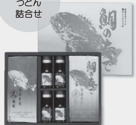
⑤TS-45 鯛の奏で 丸・平うどん 各90g×5束 鯛だし4本 定価 5,076円 特別販売価格 3,440円