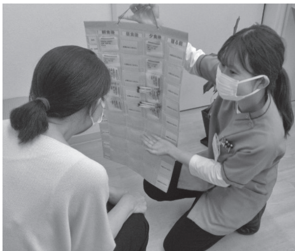
(写真1) お薬カレンダー

患者様の状況を把握し、薬剤師に相談してくれたケアマネジャーに感謝したいと思います。