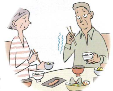
イラスト：InSightec Japan株式会社