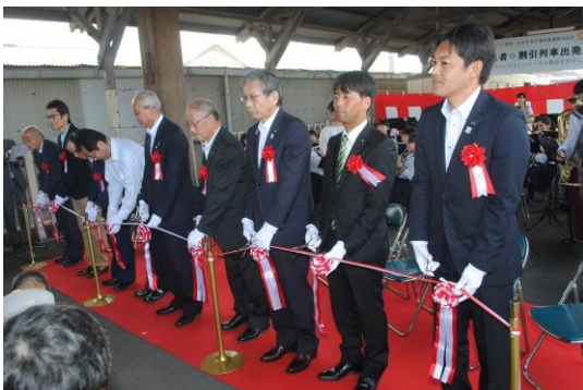
那珂湊駅で行われた出発式

障害者手帳がなくても、ひたちなか鉄道のような取り組みが全国に広がるよう、期待されます。